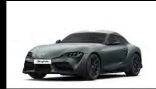
MATTE STORM GRAY METALLIC رمادي مطفي معدني