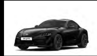
BLACK METALLIC أسود معدني