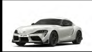
WHITE METALLIC أبيض معدني