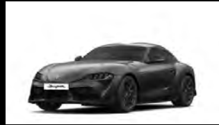
VOLCANIC ASH GRAY METALLIC رمادي رماد البركان المعدني