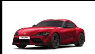
PROMINENCE RED أحمر فاخر