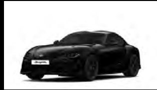
MATTE STEALTH BLACK أسود مطفي