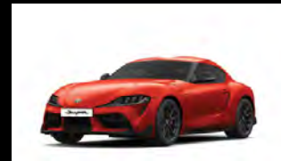
PLASMA ORANGE برتقالي بلازما