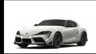
MATTE AVALANCHE WHITE ME أبيض جليدي مطفي