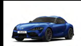
DAWN BLUE أزرق داكن معدني