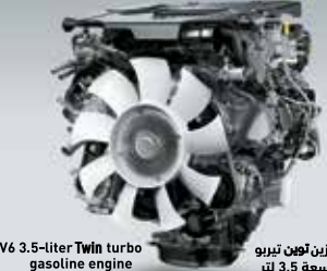
محرك بنزين توين تيربو V6 سعة 3.5 لتر V6 3.5-liter Twin turbo gasoline engine