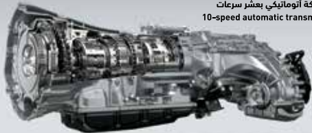
ناقل حركة أوتوماتيكي بعشر سرعات 10-speed automatic transmission