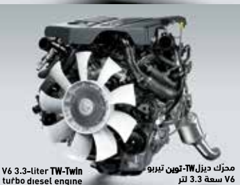
محرك ديزل TW-توين تيربو V6 سعة 3.3 لتر V6 3.3-liter TW-Twin turbo diesel engine