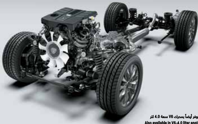
متوفر أيضاً بمحرك V6 سعة 4.0 لتر Also available in V6-4.0 liter engine