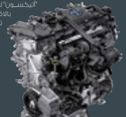
محرك 2ZR-FXE 2ZR-FXE Engine

2ZR-FXE Engine Exclusively designed for hybrid systems, the 1.8-liter engine with Dual VVT-i and Atkinson Cycle provides excellent fuel efficiency in a compact, lightweight design.